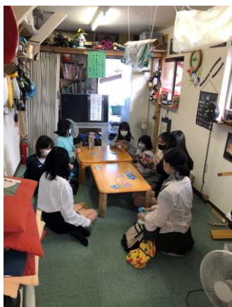
ひまわり女子でトランプ♪